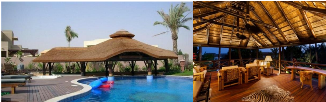
Fotografías a titulo ilustrativo

Las instalaciones básicas son un campo de golf multimodal con viviendas para alquiler turístico y se compone de cinco elementos el primero es el campo de golf de 9 hoyos, el segundo elemento una piscina tropical de 1.000 m 2 rodeado con plantas tropicales y palmeras cocoteras, el tercer elemento son 20 cabañas de 100 m 2 para 4 a 6 personas de diseño tipo balinés rodeado de una frondosa vegetación tropical, el cuarto elemento un restorán de diseño balinés con techos de juncos de 300 m 2 con pisos de madera. Por ultimo un camping con 100 parcelas en medio de la pinada de 6000 m 2 con luz y desagües. Estos podrán hacer uso del campo de golf y de la piscina.